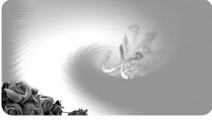
Kutlu Doğum ve Kaside-i Bür'e Abdullah Demircioğlu / 3