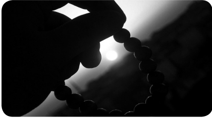
Allah'ı Zikretmesi / 15