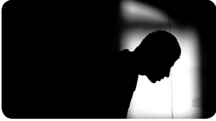
Zühtü / 11