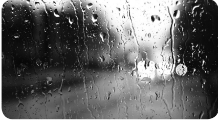
Emaneti Yüklemek Abdullah Demircioğlu / 3