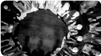
Cenabı Allah'ı Sesli Zikir (Cehri Zikir) / 4 Zülcenâheyn / 24